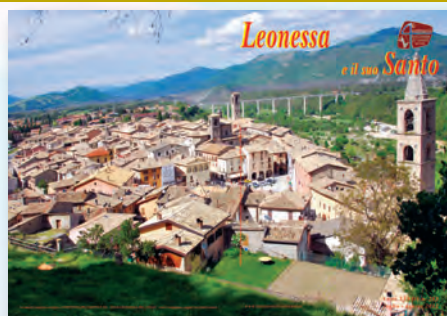
Leonessa - Panorama

Il prossimo numero della rivista , settembre - ottobre 2012, verrà spedito nella prima settimana di ottobre. Gli articoli dovranno pervenire in redazione entro il 10 settembre 2012.