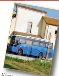
L'immobilismo sociale frena lo sviluppo di Leonessa, pag. 43.