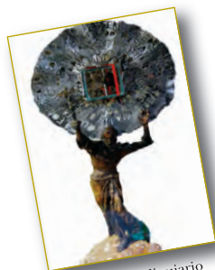
Reliquia e reliquiario della laringe di S. Giuseppe pag. 2.