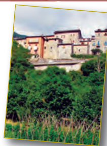
Gli orti di guerra, pag. 24.